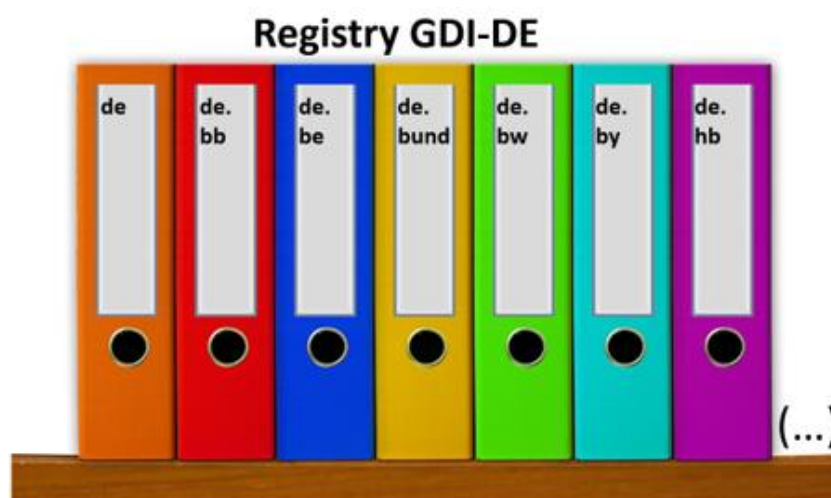
Abbildung 5: Namensräume in der GDI-DE Registry (Vereinfachte Darstellung)

Wie bereits bei der Struktur der Speicherung in Kapitel 4.1 beschrieben, müssen für aktuelle Geodaten die datenhaltenden Stellen an die GDI-DE angebinden werden. Auch muss eine Möglichkeit, am besten standardisiert, bestimmt werden, über welche Schnittstellen die Geodaten zugänglich gemacht werden und wie bestimmte Geodaten gefunden werden können. Dafür wäre die Einrichtung eines Verzeichnisregisters (Registry) von Vorteil. Das Prinzip ist dabei genau wie bei der Registry der GDI-DE und dient der Dokumentation der Daten.