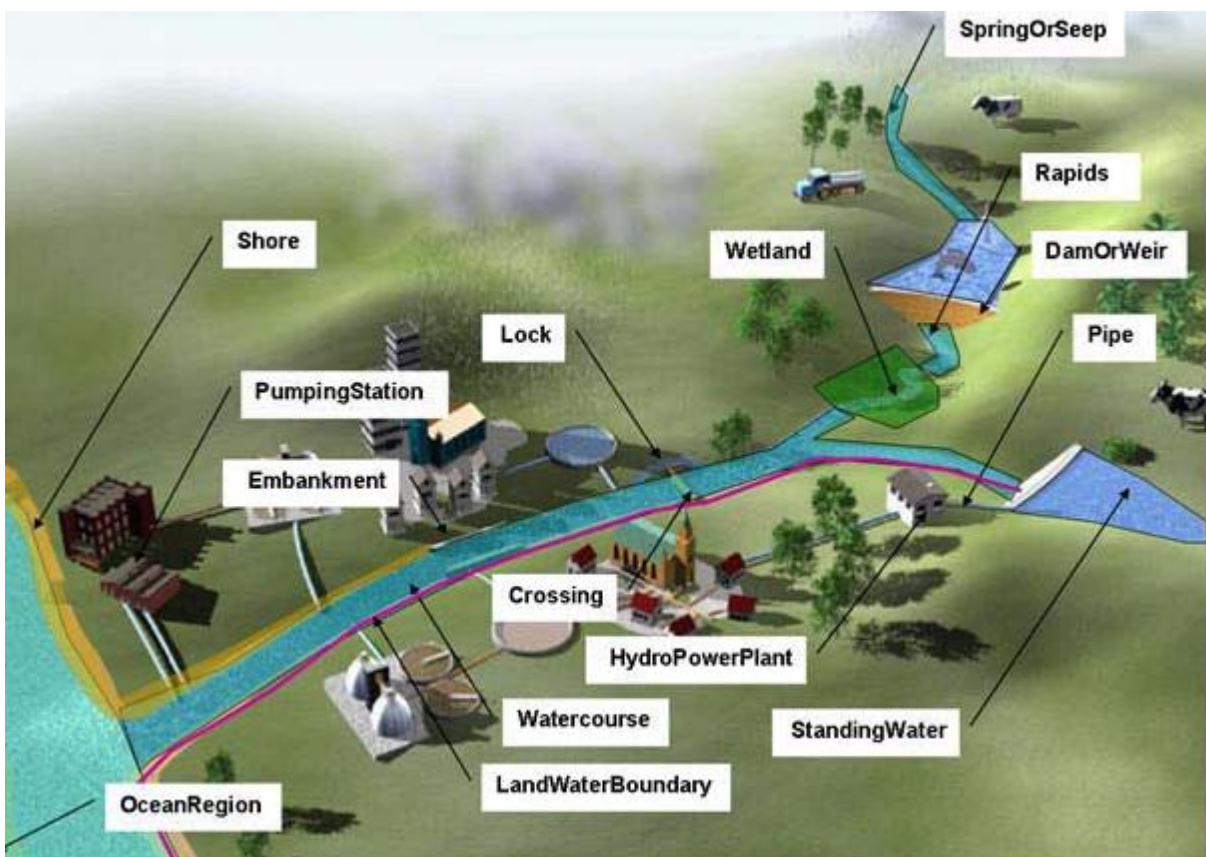
Abbildung 2: Ausgewählte Elemente des physischen Gewässernetzes und verbundene Objekte